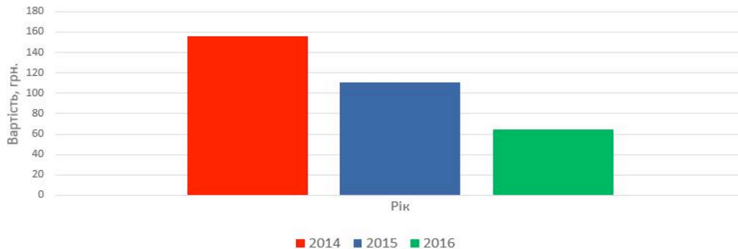
Витрати навчальних закладів, пов'язані з підтриманням доступу до ЄДЕБО, виготовленням та отриманням документів про освіту, студентських квитків для ОКР «Магістр» за навчальний цикл (2 роки навчання) (у розрахунку на 1 (одного) студента)